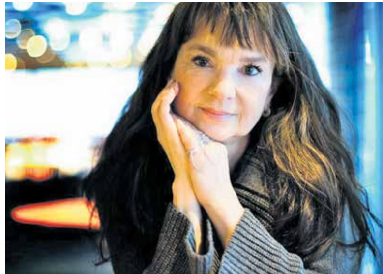
Christina Lindberg je z vlogo enooke maščevalke v kulturni klasiki Triler: krut film navdihnila Quentina Tarantina za filma Ubila bom Billa .