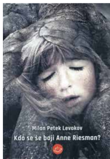
Založba eBesede, Ljubljana 2019

Anne Riesmann je ime dekleta, ki je v pripovedovalčevi vasi izginilo med drugo svetovno vojno. Po vojni je kot otrok slišal izgovarjati njeno ime, vtisne se mu v zavest in ga ne spusti. Zato je najprej fant in potem